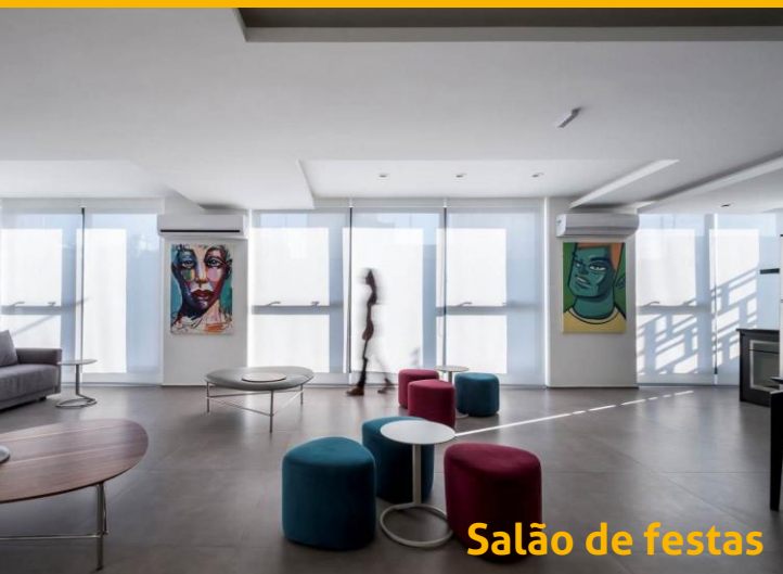
Salão de festas